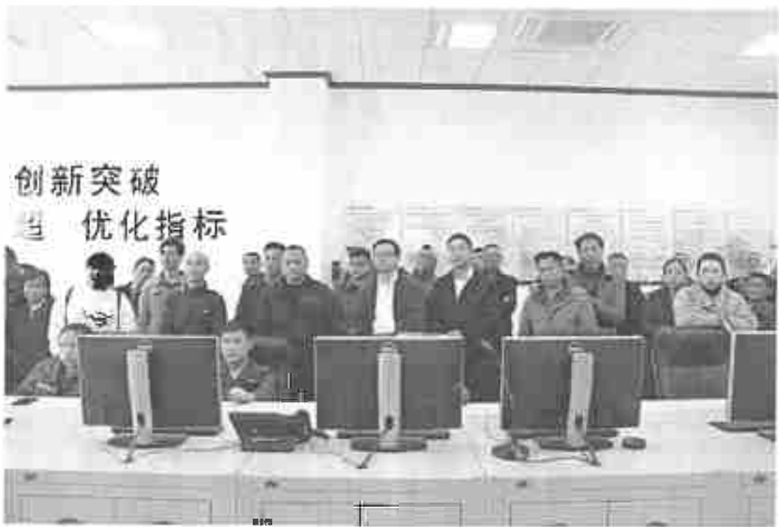
投产项目实地考察